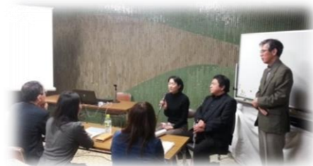
職業スキルアップセミナー