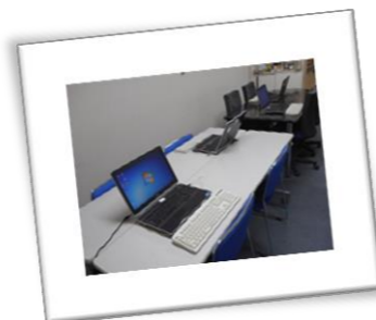
■ SPANの教室「スカイプラザ」の愛称で呼ばれ、コンパクトでアットホームな雰囲気です。

2014年7月21日 発行 特定非営利活動法人 視覚障害者パソコンアシストネットワーク(SPAN) 〒108-0014 東京都港区芝 5-29-22 フェリス三田 1103 電話&ファクシミリ 03-6435-1614 E-mail office@span.jp URL http://www.span.jp/ Facebook https://www.facebook.com/span.jp Twitter https://twitter.com/npo_span